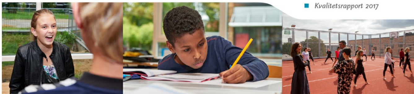
■ Kvalitetsrapport 2017